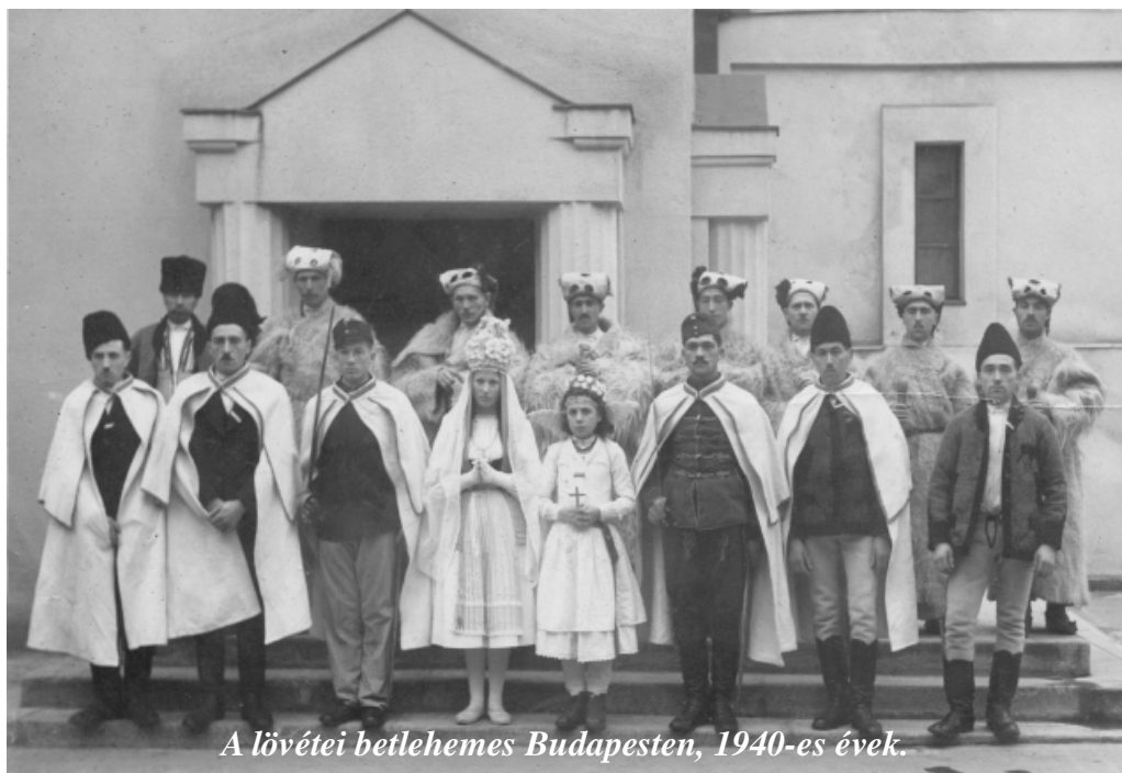
A lövétei betlehemes Budapesten, 1940-es évek.

"Legyen a földön béke, boldogság, soha ne legyen a szívekben gszság! Szeretemben teljen el a karácsony, én mindenkinek ezt kívánom!"