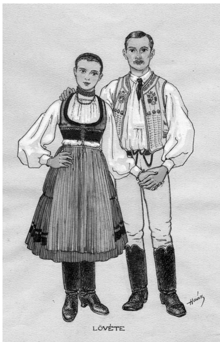
Lövétei leány és legény (Haász Rezső rajza, Székelyudvarhely, 1929.)

Eladó hétvégi ház, 10 ár területtel Szeltersz völgyében. Irányár 20000 euró. Telefon: 0036308663098, 0786146733.