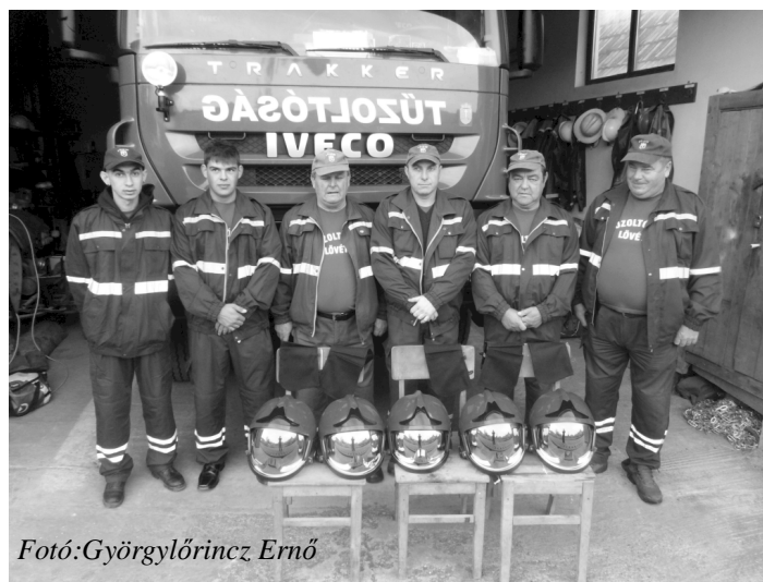
Fotó: Györgylőrincz Ernő