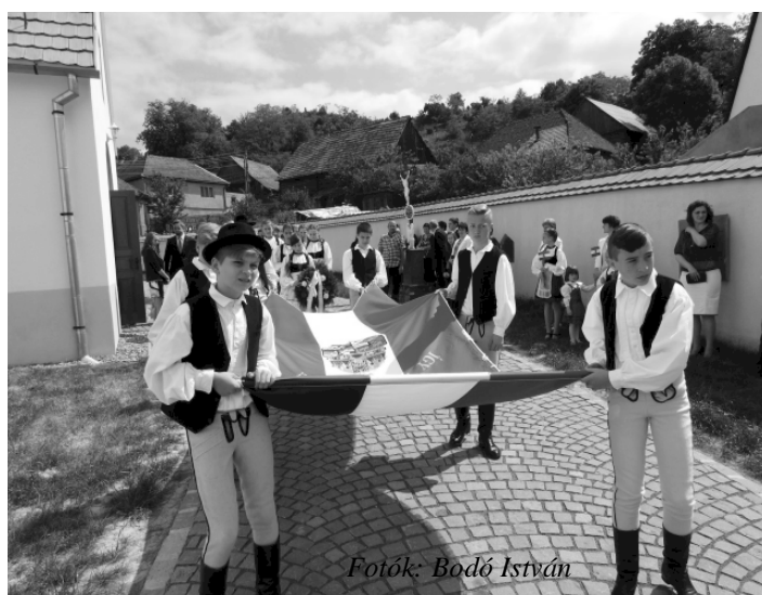
Fotók: Bodó István