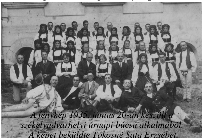
A fénykép 1935. június 20-án készült a székelyudvarhelyi úrnapi búcsú alkalmából. A képet beküldte Tókosné Sata Erzsébet.