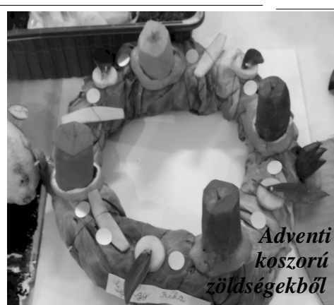
Adventi koszorú zöldegekből