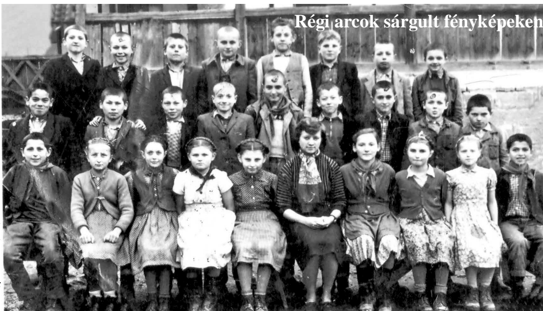
Régi arcok sárgult fényképeken