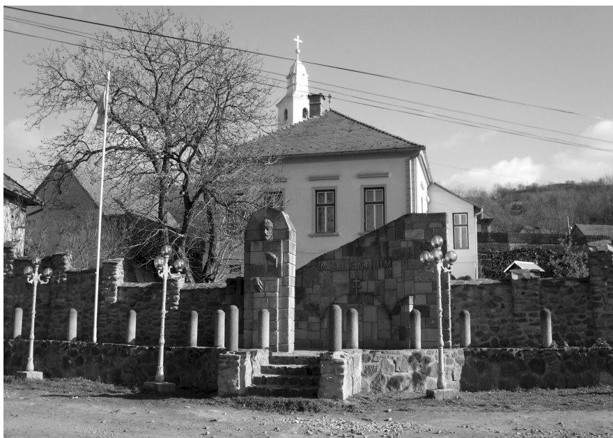
A Millenniumi emlékmű