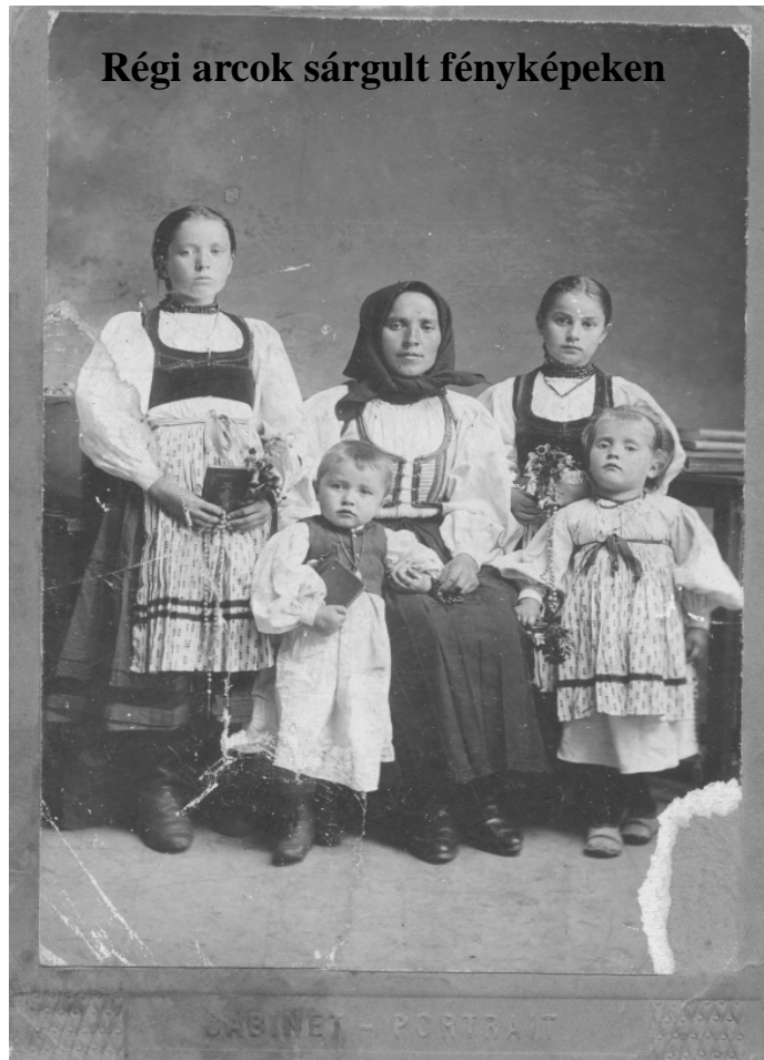
Lövétei székely asszony gyermekeivel.

Eladó asztali kályhához való inox tartály (füstcső melegíti a vizet). Telefon: 0735-501494.