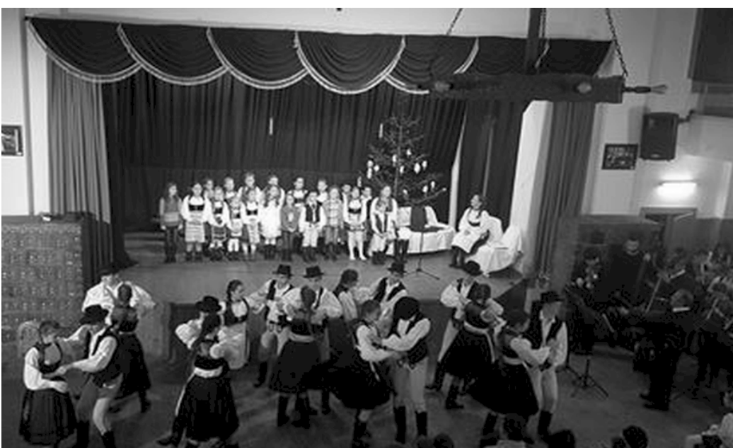
Pillanatkép a karácsonyi előadásról