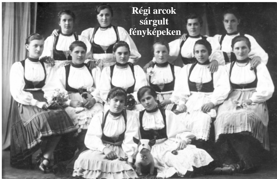
Lövétei leányok Brassóban (1938. május 2.).

- Valami szúrja a lábamat, sántikál a székely. - Tán egy kavics - mondja a komája. Lehúzza a székely a csizmáját, nézegeti, de nem talál benne semmit. Megszólal a komája: - Biztosan a másikban van!