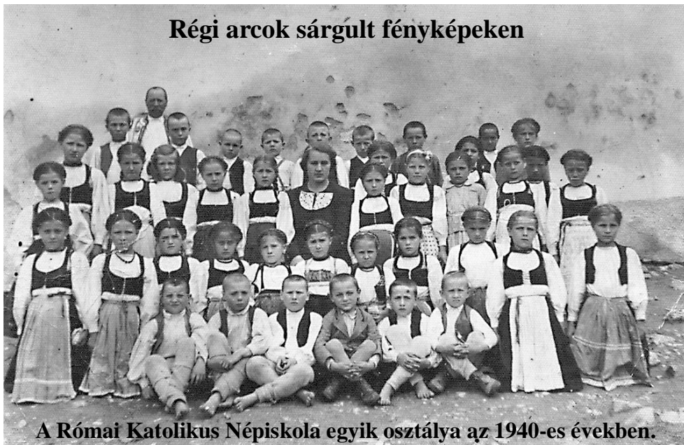
A Római Katolikus Népiskola egyik osztálya az 1940-es években.