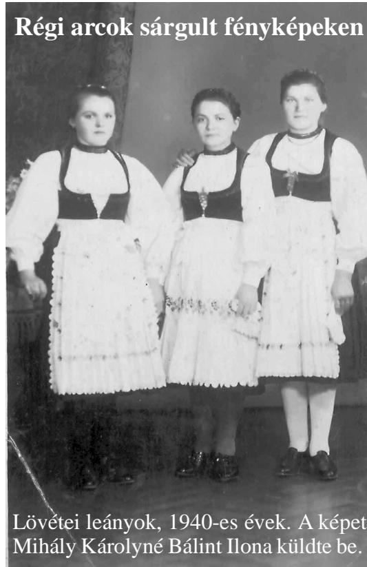
Régi arcok sárgult fényképeken

- Biztos anyádtó', fiam, me' az enyim még megvan!