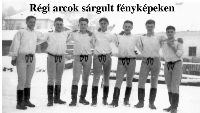
Régi arcok sárgult fényképeken

A lövétei Székely Mózes Általános Iskola versenyvizsgát hirdet egy takarítói állás betöltésére. Érdeklődni az iskola titkárságán lehet.