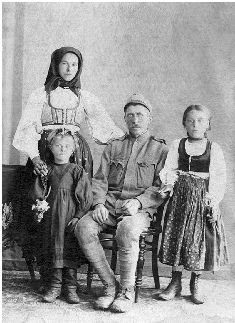
Harctérre indulás előtt (1914).