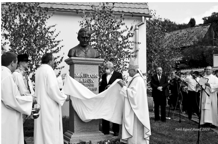
Fotó: Egyed József, 2020