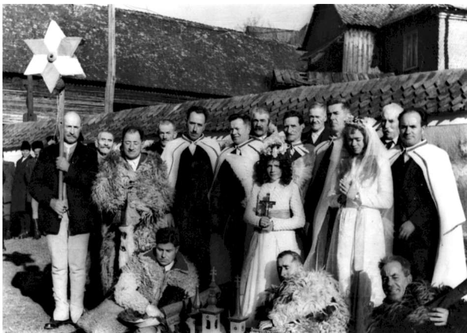
A régi lövétei betlehemes játék egykori szereplői, 1970-es évek eleje.