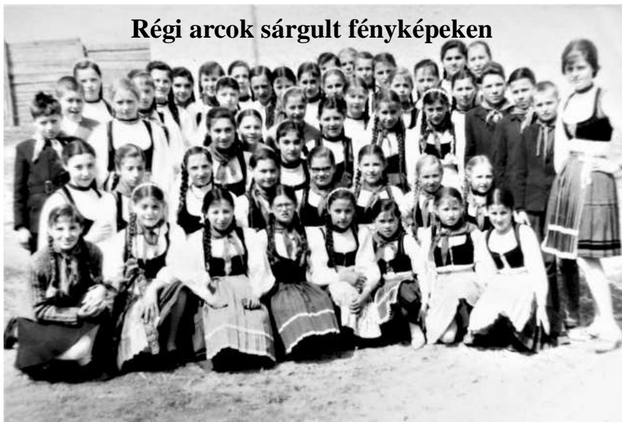
Az V - VIII. osztályos énekkar. Lövéte, 1965. V. 20.