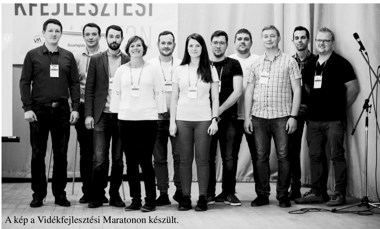
A kép a Vidékfejlesztési Maratonon készült.