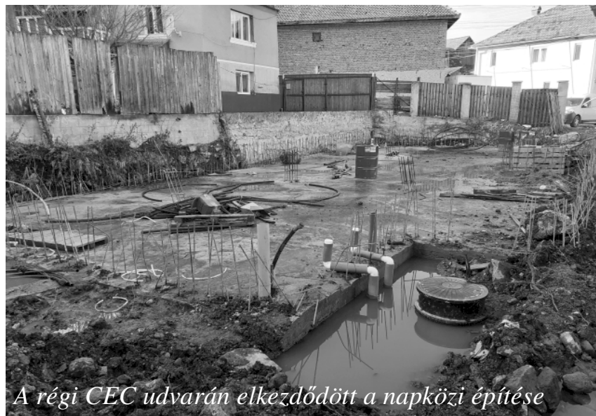
A régi CEC udvarán elkezdődött a napközi építése