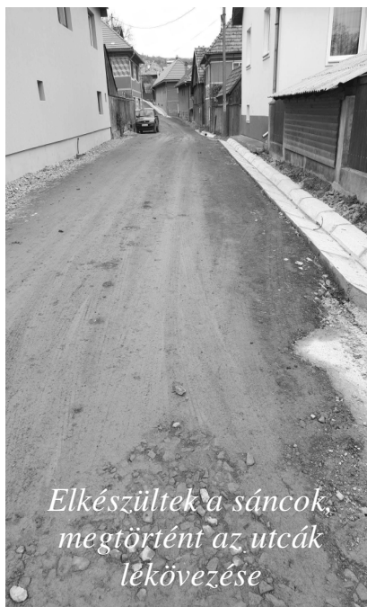
Elkészültek a sáncok, megtörtént az utcák lékövezése