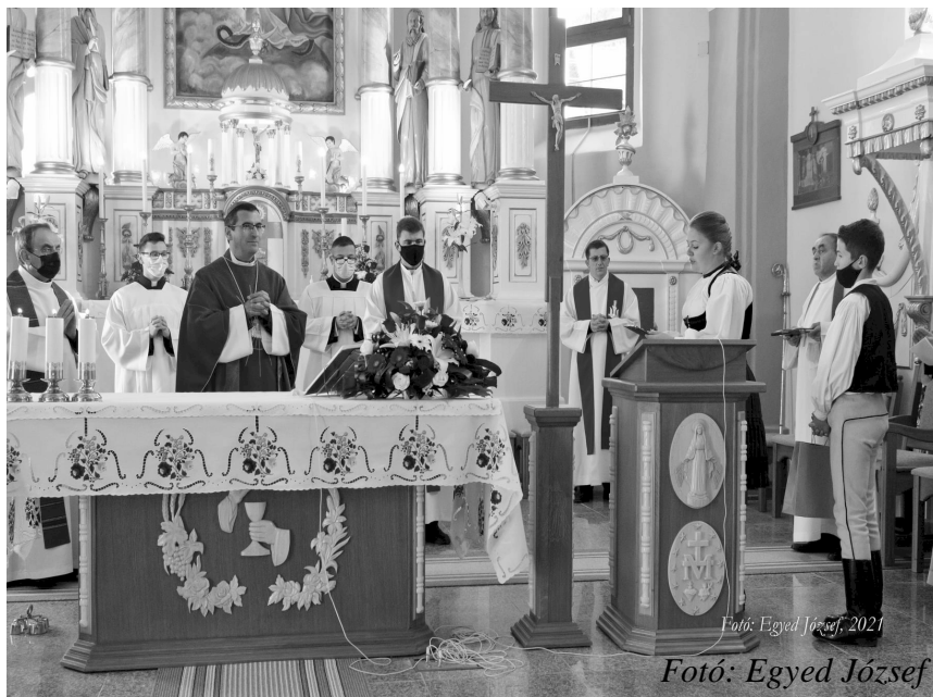
Fotó: Egyed József, 2021