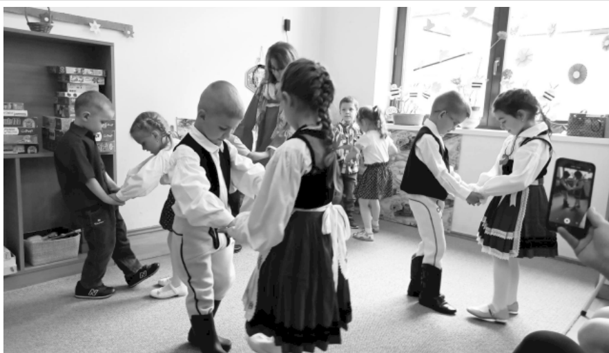
Évzáró a pósfalusi óvodában