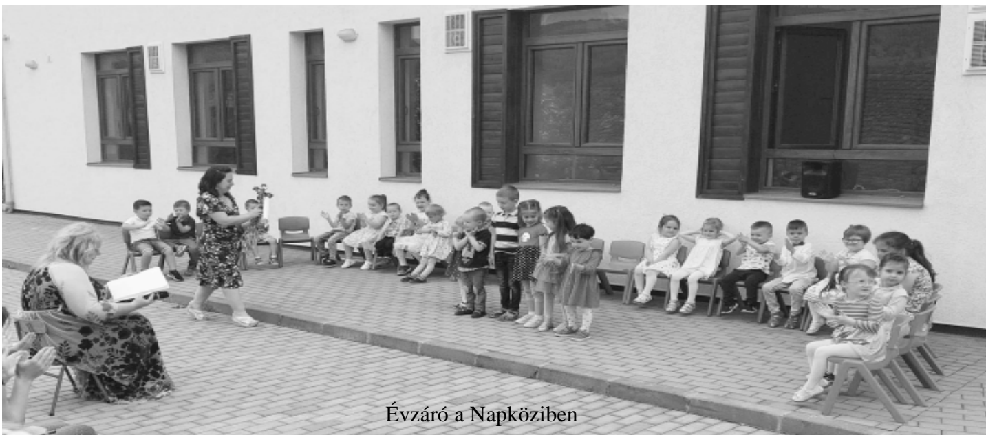
Évzáró a Napköziben