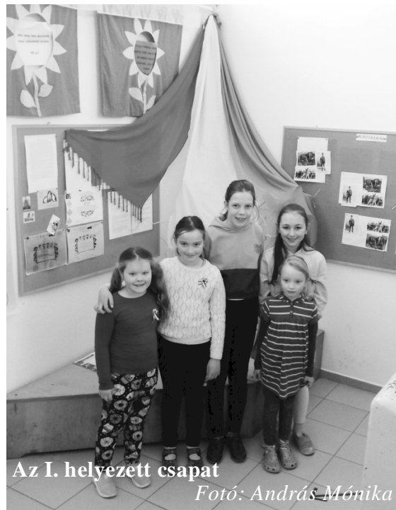
Az I. helyezett csapat