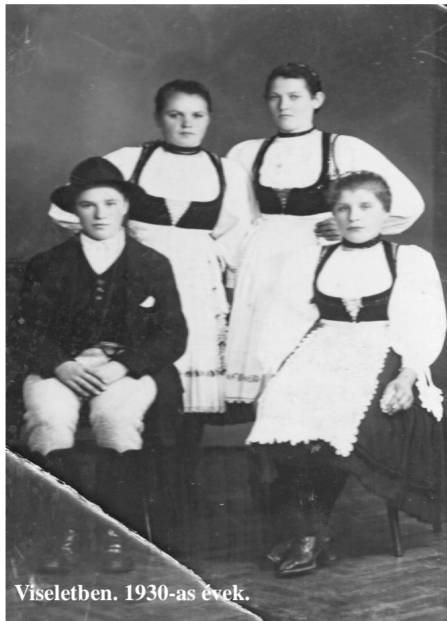
Viseletben. 1930-as évek.