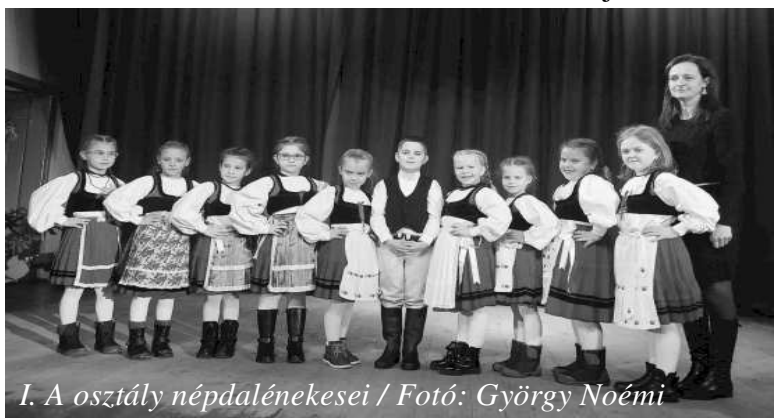
I. A osztály népdalénekesei