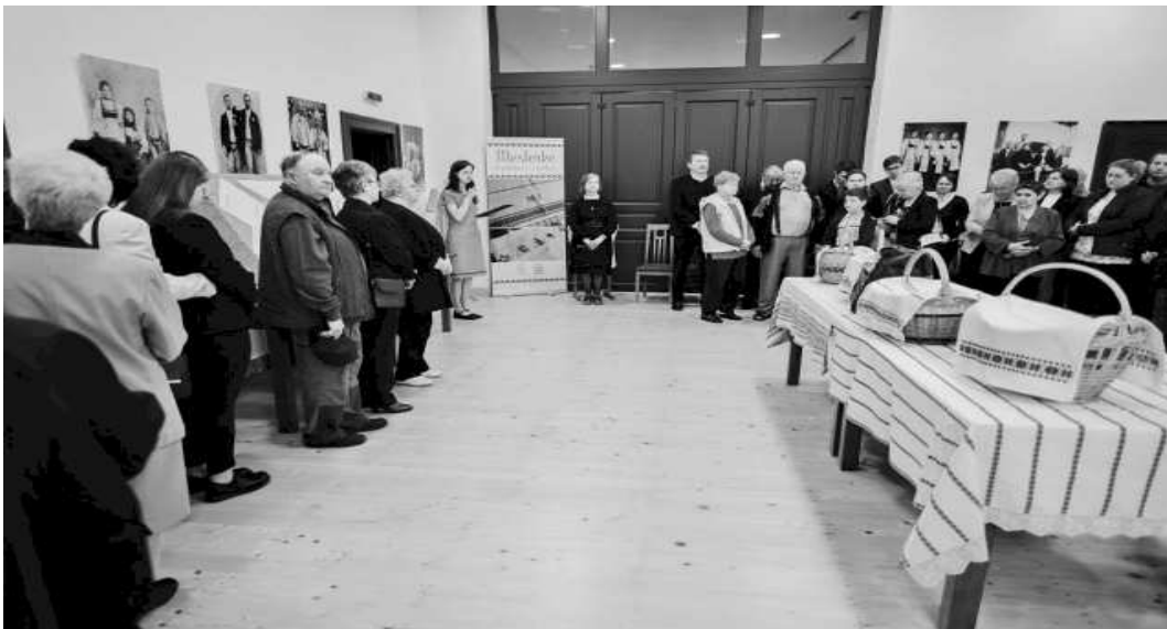
Mesterke népi-hímzés szakkör záró kiállítása