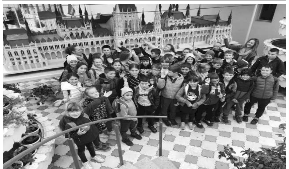
Ditróban parlament is van. Láttátok már?