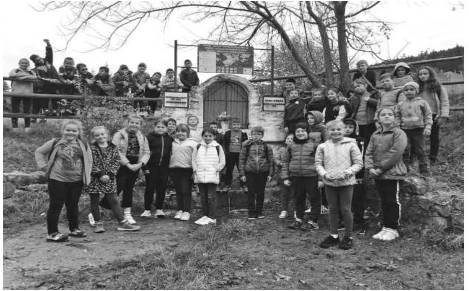
A harmadikosok és negyedikesek jártak a Maros forrásánál