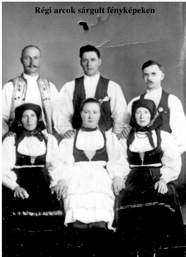
Régi arcok sárgult fényképeken

Eladó a Gál utca, 1082. szám alatti bennvaló. Érdeklődni lehet a következő telefonszámokon: 0740260916, 0749409236.