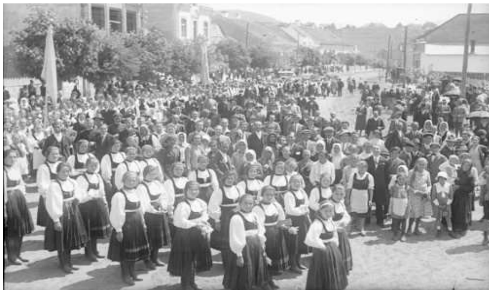
Ezer Székely Leány Napja Csíkszeredában az 1930-as évek elején. (1931. június 7.)

Eladó Újnegyedben a 15. szám alatti bennvaló. Az ingatlan telekkönyvvvel rendelkezik. Telefonszám: 0723925402.