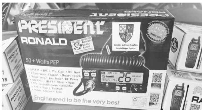
Szöveg és fotó: Györgylőrincz Ernő

A Lövetei Önkéntes Tűzoltó Egyesület újabb sikeres pályázatot nyert meg. A Hargita Megye Tanácsához leadott pályázat 6000,00 lej támogatásban részesült. Ez az összeg a bevételek alkalmával elengedhetetlen és szükséges kommunikáció javítására, a jel nélküli területeken a kapcsolattartás megerősítésére, rádióállomás és adóvevők vásárlására, beszerzésére volt felhasználva. A pályázat önrészét (1000 lej) a Polgármesteri Hivatal biztosította. Köszönjük a Hargita Megyei Tanácsnak és a Lövetei Polgármesteri Hivatalnak az újabb támogatási lehetőségeket, amelyek segítségével hatékonyabban, biztonságosabban tudunk beavatkozni katasztrófák esetén.