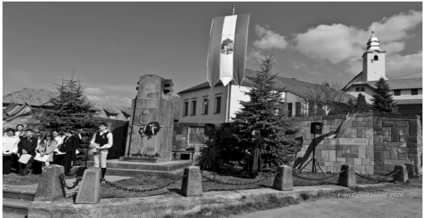
Fotó: Egyed József, 2026

Isten éltesse Lovétét, és Isten éltesse a magyar szabadságot!